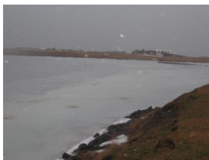
Mynd 4. Hrossatað á tjörninni. Varnargarðurinn hægra megin, hólminn og Jörfi í baksýn.

Jörð var að mestu auð við skoðun beitarlandsins 29. desember enda hafði þá verið tveggja daga hláka. Að sögn umráðamanna eru jarðbönn fremur sjaldgæf á þessu svæði og standa þá stutt yfir vegna legu landsins. Hrossin hafa aðgang að Bessastaðatjörn og drekka alla jafna úr henni. Að sögn umráðamanna er saltmagnið í tjörninni það lítið að það hefur ekki áhrif á drykkjarlyst hrossanna. Þegar slysið átti sér stað hafði tjörnina lagt en snjór á jörðu ætti að hafa fullnægt þörfum hrossanna fyrir vatn.