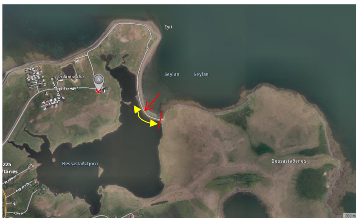
Mynd 3. Garður sýndur með rauðri pílu. Hlið sýnt með rauðu striki. Gul lína merkir grófa útbreiðslu hrossataðsins sem sást við vettvangsskoðunina. Tað var einnig ofan á garðinum.