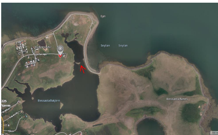
Mynd 2. Hólminn og drukknunarstaður (rauð píla á mynd). Jörfi merktur með A.

Hrossunum var smalað laugardaginn 20. desember og uppgötvaðist þá að 12 hross vantaði. Áður höfðu 8 hross verið tekin úr hópnum. Við leit daginn eftir smölun fundust 12 hræ í Bessastaðatjörn skammt undan landföstum hólma sem liggur í tjörninni austan við bæinn Jörfa (mynd 2).